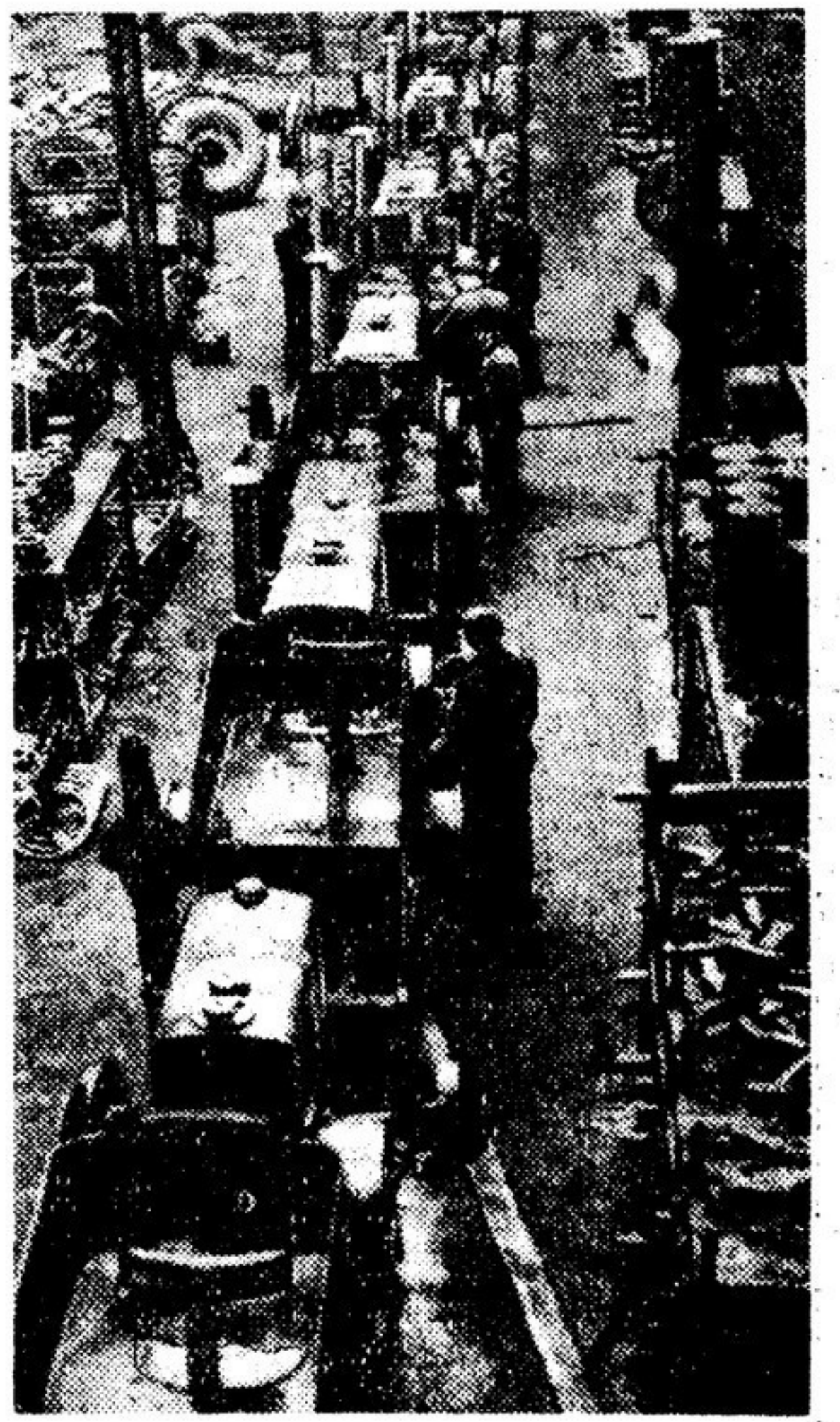
Тракторный завод «Урсус». На снимке: общий вид конвейера, где производится сборка тракторов.

Адрес редакции и издательства: Москва И-51, Цветной бульвар, 30 (для телеграмм — Москва, Литгазета). Телефоны: секретариат — К 4-04-62, разделы: литературы и искусства — К 4-02-29, внутренней жизни — К 4-08-89, К 4-72-88, международной жизни — К 4-03-48, науки — Б 3-27-54, отдел информации — К 4-08-69, писем — Б 1-15-23, издательство — К 4-11-68. Коммутиатор — К 5-00-00.