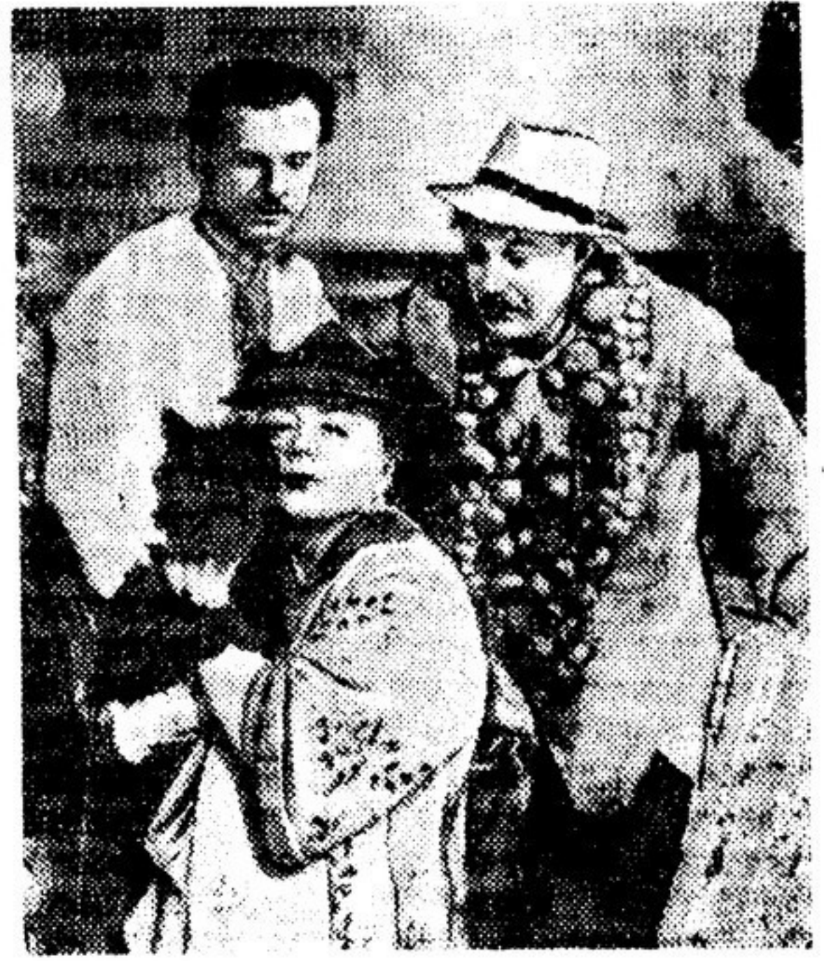
Кадр из фильма «Веселые звезды».